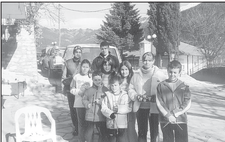
Κάλαντα στο χωριό.