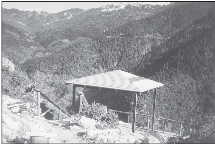
Η θέση θέας και αναψυχής στα Αγκωνάρια.

Το Δ.Σ. παρακάλεσε τον Κώστα Φούρλα να επισκεφτεί