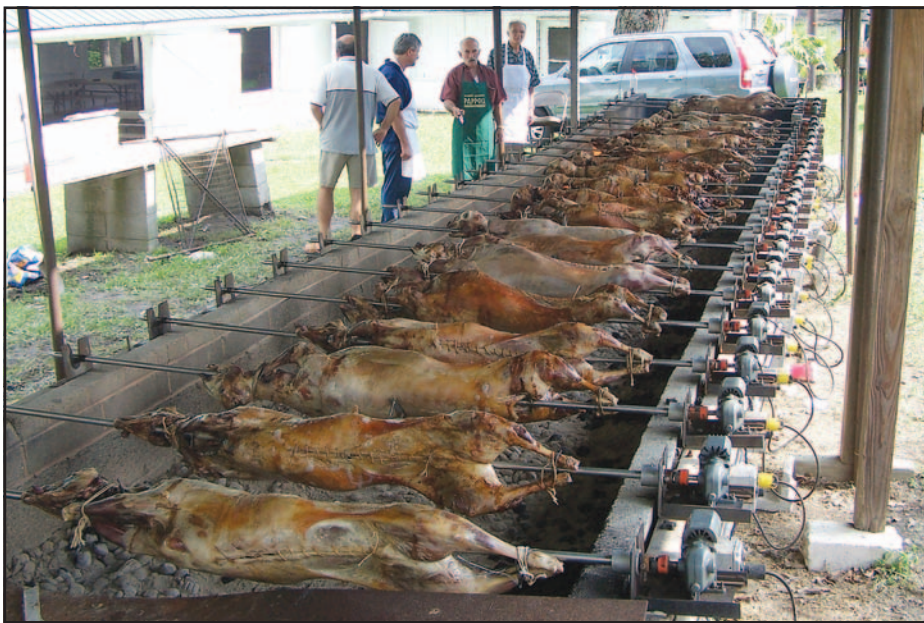
Τα αρνιά σε παράταξη ψήνονται.