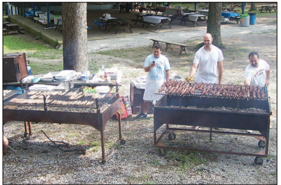
Τα Σουβλάκια στα κάρβουνα.