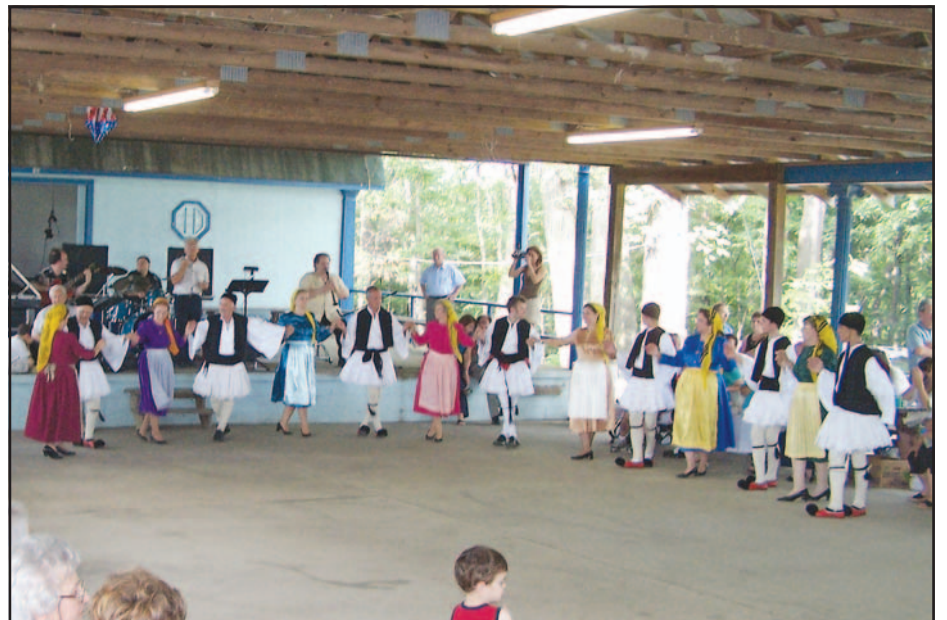
Και το γλέντι ξεκίνησε.