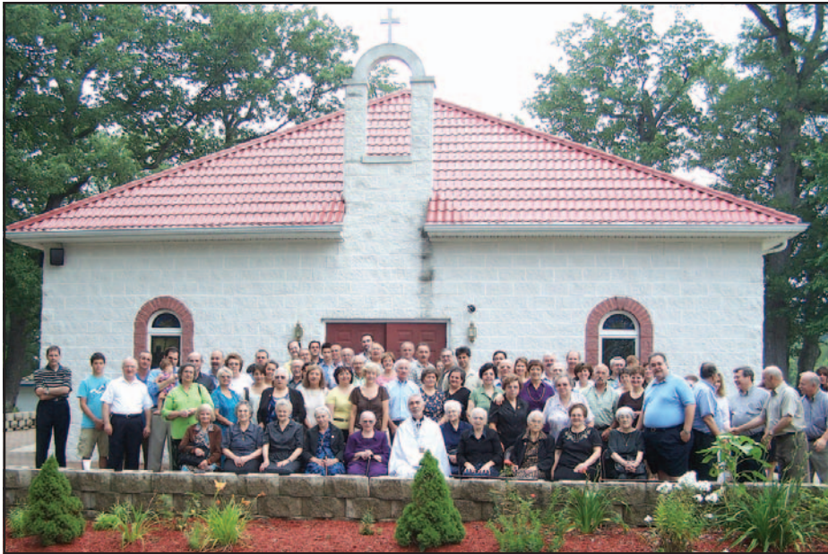
Μετά τη Θεία Λειτουργία η καθιερωμένη αναμνηστική φωτογραφία.