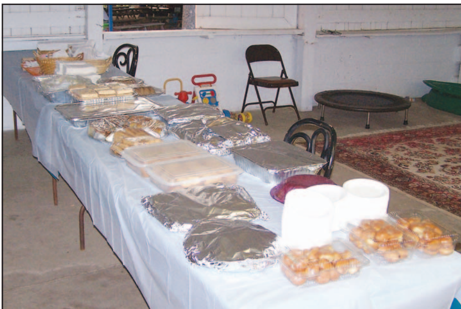
Οι πίτες και τα γλυκά περιμένουν τους «παγκυριώτες».