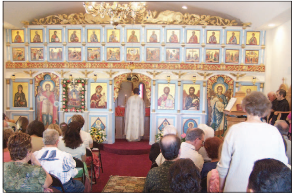
Το εσωτερικό της Εκκλησίας.