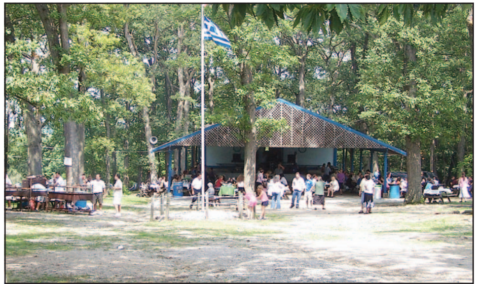
Από το Πάρκο των Νεοχωριτών.