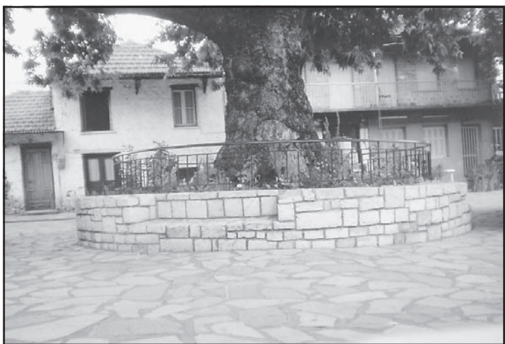
Με έξοδα του Ανδρέα Ασημακάκη κατασκευάστηκε και τοποθετήθηκε κιγκλίδωμα γύρω από το πλατάνι για να προστατεύονται τα λουλούδια.