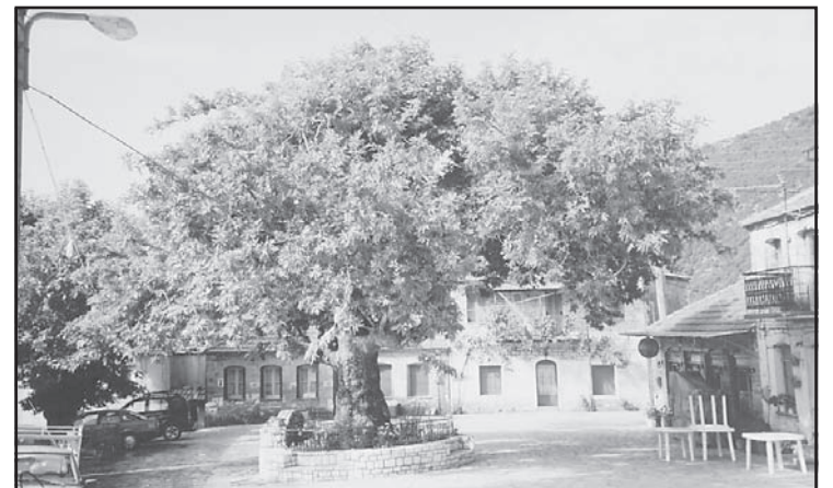
Το πλατάνι της πλατείας μετά το κλάδεμα απέκτησε πλούσια κόμη. Επομένως θα έχουμε καλό ίσκιο το καλοκαίρι.

Τα Κατασπάματα (του Φούρλα, του Καλαθά και του Κοπάνη) ανέλαβαν το ψήσιμο των κατσικιών, που ήταν έτοιμα στην ώρα τους. Το μεσημέρι στην αίθουσα του Σχολείου, όπως κάθε χρόνο, φάγαμε και γλεντήσαμε μέχρι τις απογευματινές ώρες.