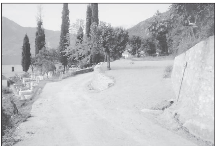
Η είσοδος του πάρκινγκ όπως διαμορφώθηκε μετά την ανακατασκευή της μάντρας.