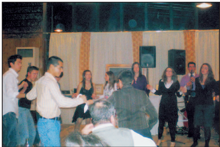
Νέοι του χωριού μας στο χορό του Συλλόγου.