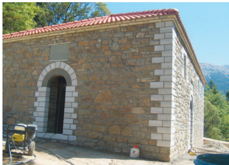
Συνεχίζονται οι εργασίες ανακατασκευής στο εξωκλήσι