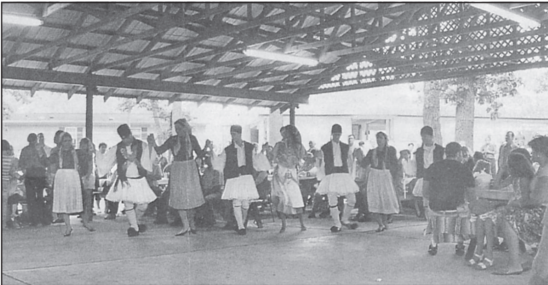
Όλη τη μέρα αντηχούσε από τη δημοτική μουσική και τα τραγούδια το ιδιόκτητο πάρκο του Συλλόγου των Νεοχωριτών στην περιοχή Γιορκ της Πενσυλβάνια. Οι Νεοχωρίτες και οι φίλοι τους είχαν την ευκαιρία να χορεύουν όλη τη μέρα, όπως φαίνεται και στη φωτογραφία.

μιούσε. Μετέφερε, επίσης, χαιρετιστήρια μηνύματα του ιερέα της εκκλησίας του χωριού τους στο Νεοχώρι,