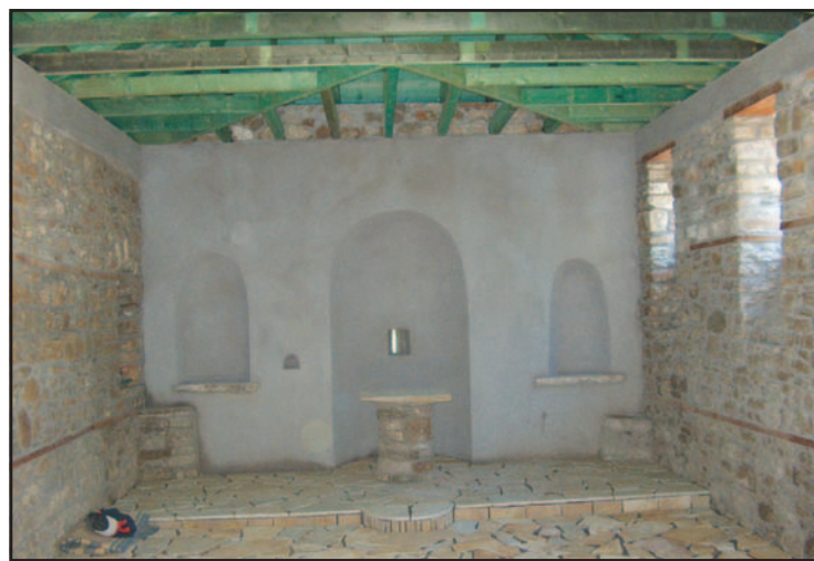
Εσωτερική άποψη, από το εκκλησάκι.

✓ Άγιοι Απόστολοι: Οι εργασίες στο εκκλησάκι των Αγίων Αποστόλων βρίσκονται στο τέλος. Αποτελεί πράγματι κόσμημα για το Νεχώρι και την περιοχή. Ανάλογη προσοχή πρέπει να δοθεί και στην εσωτερική διακόσμηση του Ναού (Τέμπλο και Εικόνες, Καντήλια και Μανουάλια, Στασίδια και Αναλόγια).