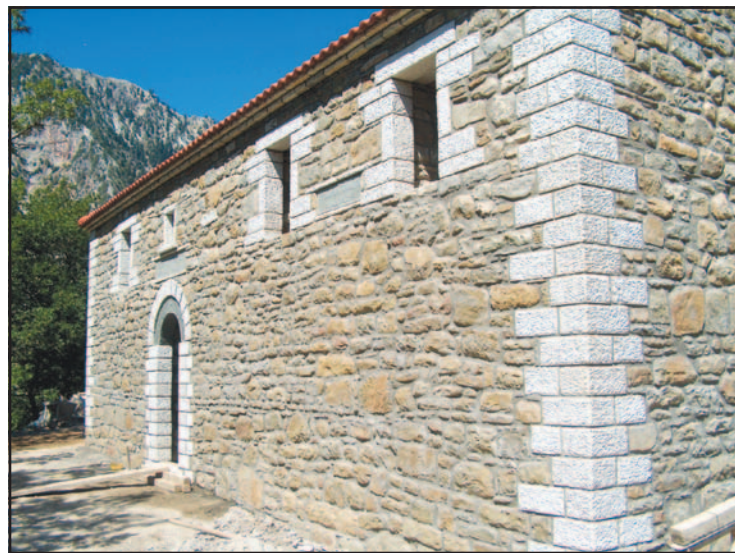
Το εκκλησάκι των Αγίων Αποστόλων.