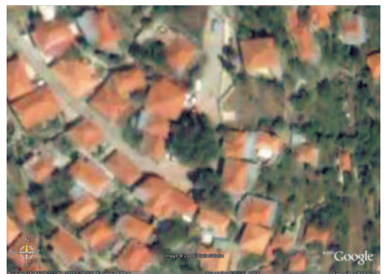
Κοντινή άποψη της πλατείας του χωριού που φαίνονται καθαρά τα δύο πλατάνια και το Μνημείο των Πεσόντων