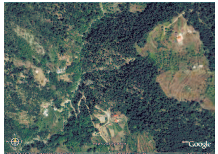
Άποψη της Αγίας Παρασκευής (δεξιά επάνω). Διακρίνονται επίσης και σπίτια στο Παλιονέχωρο