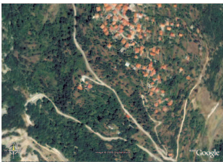
Άποψη του κάτω μέρους του χωριού όπου διακρίνονται επίσης ο Αι-Γιάννης (κέντρο κάτω) και τα Λιμστά (αριστερά κάτω)