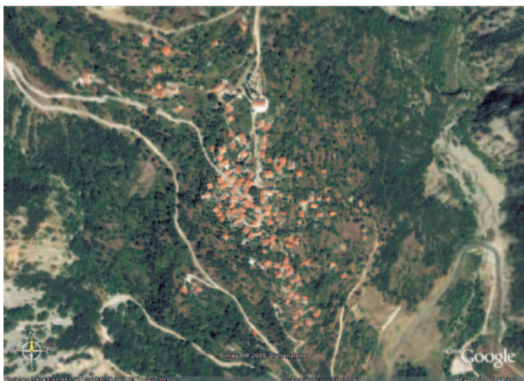
Συνολική άποψη του χωριού