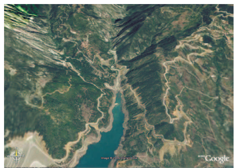
Εξαιρετική πανοραμική άποψη της περιοχής μας. Διακρίνονται καθαρά το χωριό, μέρος της Εηνολίμνης και του φράγματος. Αριστερά ο Καρφοπεταλιάς και δεξιά επάνω η Αράχωβα.