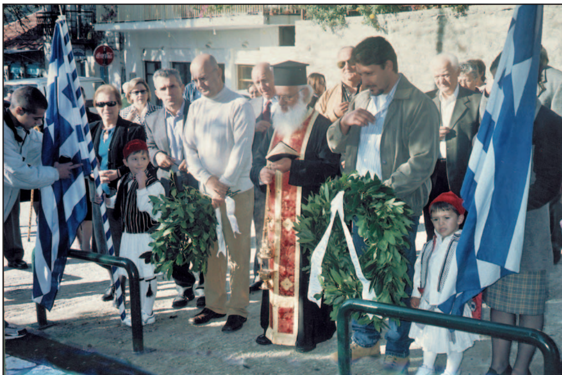
Κατάθεση στεφάνου στο Μνημείο Πεσόντων.

Γιορτάστηκε και φέτος στο Χωριό μας η 28η Οκτωβρίου.