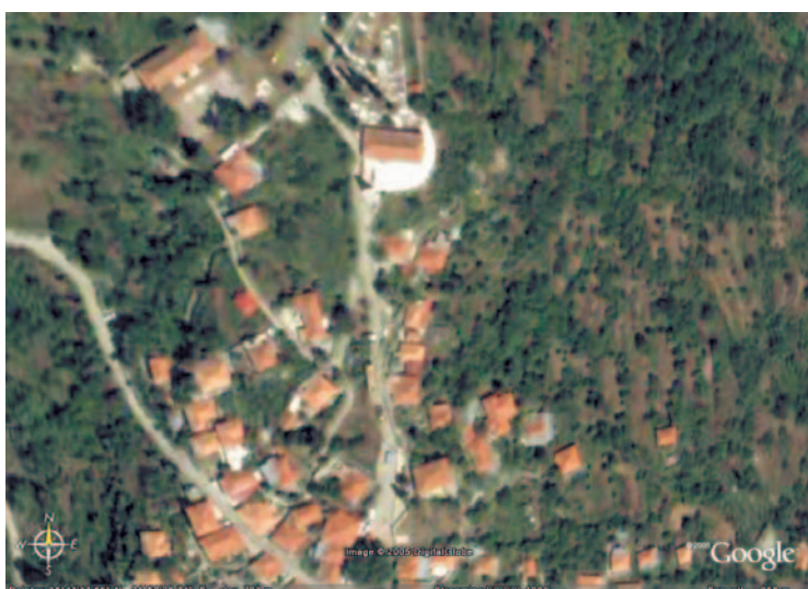
Σε αυτή την φωτογραφία φαίνονται καθαρά η πλατεία (κέντρο κάτω), η εκκλησία και το σχολείο (επάνω)