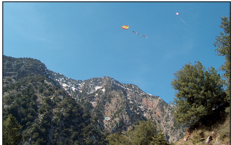
Καθαρή Δευτέρα στο Νεχώρι.