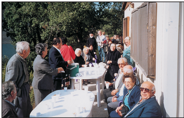
Καφές μετά την εκκλησία στο "λυόμενο" της γιαγιάς Κυρίκας.

λαθός προσέφερε σε όλους, καφέ, γλυκό, τσίπουρο και α- ναψυκτικά στο προκατα-