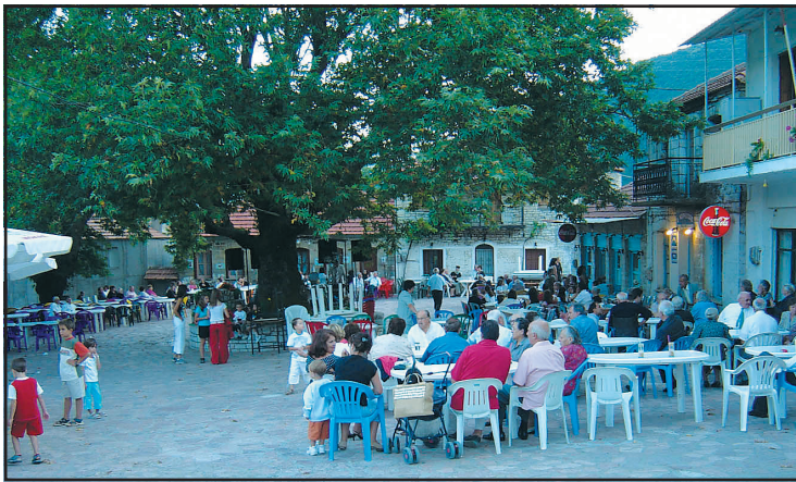
Η πλατεία (Μεσοχώρι) περικυκλωμένη από σπίτια και καταστήματα δείχνει σαν μια ζεστή αγκαλιά.

Δεν είναι τυχαίο επίσης ότι οι δύο Σύλλογοι του χωριού ο ένας με έδρα την Αθήνα