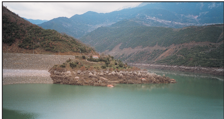
Τα Καλαθείκα βυθισμένα στη λίμνη.

σκευασμένο σπιτάκι, δίπλα στο εκκλησάκι, όπως έκανε